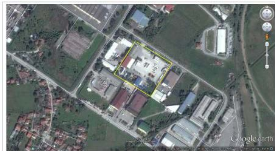
Слика 2. Микролокација и граници на локација на инсталацијата