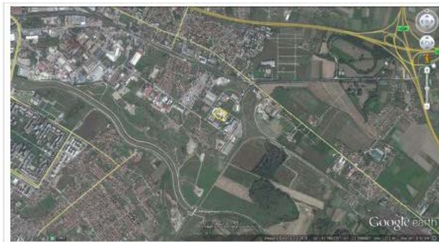
Слика 1. Макролокација и граници на локација на инсталацијата