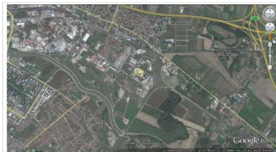
Слика 1. Макролокација и граници на локација на инсталацијата