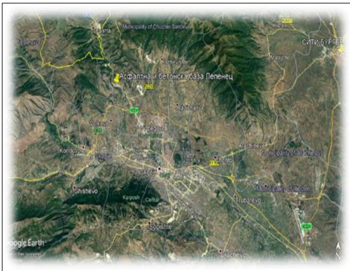
Слика 2. Мапа на локацијата со географска положба и јасно назначени граници на инсталацијата

06.08.1 Инсталацијата ќе работи, ќе се контролира, ќе одржува и емисиите ќе бидат такви како што е наведено во оваа Дозвола. Сите програми кои треба да се изготват според условите во оваа Дозвола стануваат дел од Дозволата.